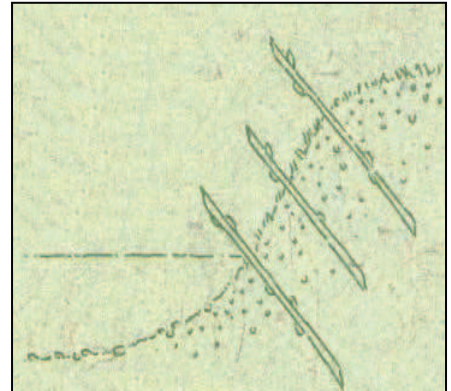
Croquis 2 : technique de bobouturage.